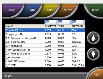
Bibliothèque de programmes