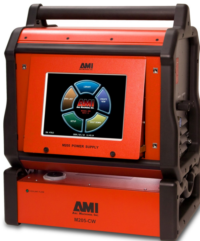
Montré avec l'unité de refroidissement